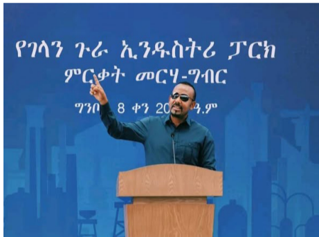
የገላን ጉራ ኢንዱስትሪ ፓርክ ምርቃት መርሃ-ግብር ግንቦት 8 ቀን 2018 ዓ.ም